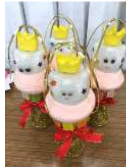
手作りのトロフィー

2月22日（木）の表彰朝礼で、給食委員会と保健委員会が実施したキャンペーンの表彰を行いました。給食委員会では1月27日～31日まで『空っぽ食缶キャンペーン』を行いました。これは野菜を多く使っている献立の残菜量を毎日計量する取り組みです。三日間完食だったクラスは、1年1組、3組、6組、2年生は2組、6組、3年生は2組、4組、6組、そして10組の合わせて9クラスでした。昨年の完食クラスは17クラスでしたので、来年度はぜひがんばりましょう。